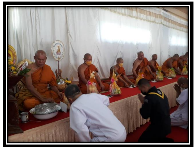
การถวายเครื่องไทยธรรม ถวายสังฆทาน