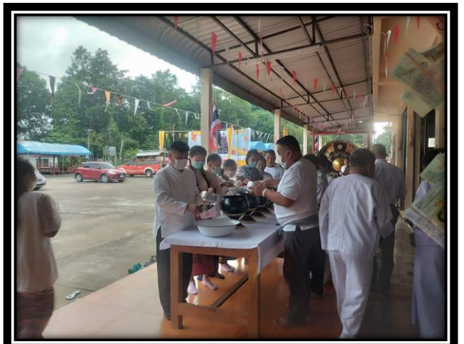
การทำบุญตักบาตร อาหารแห้งและอาหารคาวหวาน