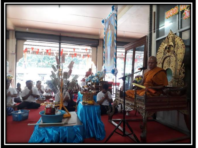
การแสดงพระธรรมเทศนา “บทพระธรรมเทศนาเฉลิมพระธรรมบารมี”